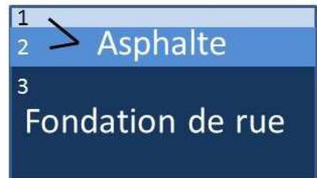
Conduites et entrées de service

Ce type de travaux d'entretien régulier est effectué à la surface de la chaussée . Environ 50 mm d'asphalte sont enlevés et remplacés lors de ces interventions rapides qui prolongent la durée de vie d'une rue de quelques années. Les entrées de service en plomb du côté public ne seront pas remplacées durant ces travaux, car ils sont habituellement situés à 1,8 mètre sous le niveau de la rue. En conséquence, il n'y aura aucune excavation, ni reconstruction des conduites d'aqueduc ou d'égout ou des trottoirs durant ces travaux.